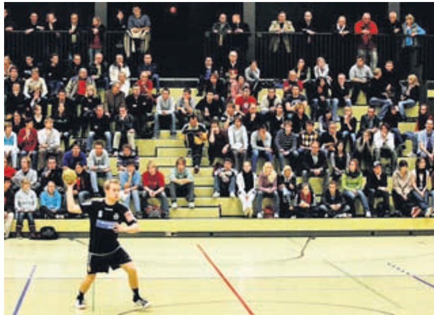
Nicht im Rankhof. Auch im Joggeli hofft der RTV auf viele Zuschauer.

RÜCKKEHR. Letztmals trugen die Basler Handballer im Frühling 2002 einen Ernstkampf in der Brüglinger Ebene aus. Seither trainiert und spielt der RTV im Rankhof. «Deshalb wird am Samstag für uns in dieser ungewohnten Umgebung schon vieles anders sein», sagt Torhüter Stauber, der letztmals in der Saison 1997/1998 in der kleinen Joggelihalle zwischen den Pfosten stand.