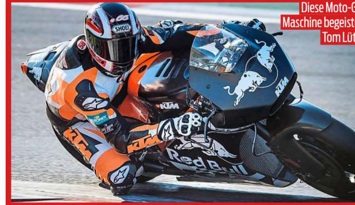
Diese MotoGP-Maschine begeistert Tom Lüthi.

T om Lüthi hat die Premiere in Mugello erfolgreich hinter sich gebracht. Der erste Test mit einer MotoGP-Maschine. 57 Runden spult er ohne Probleme ab. Tom ist happy. Kein Wunder, lange musste er auf diesen Moment warten. 2005, nach dem WM-Titel bei den 125ern mit Honda, durfte er mit der damaligen MotoGP-Maschine der Japaner ein paar Runden drehen als Dankeschön. Doch echte Tests – das war bis jetzt Fehlanzeige. «Es war sehr gut, wirklich cool. Ich hatte viel Spass», sagt Lüthi nach der Premiere. «Auf so eine MotoGP-Maschine zu sitzen, war schon eindrücklich, vor allem dann die Beschleunigung. Das war eine grosse Herausforderung.»