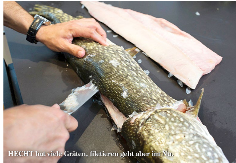
HECHT hat viele Gräten, filetieren geht aber im Nu.