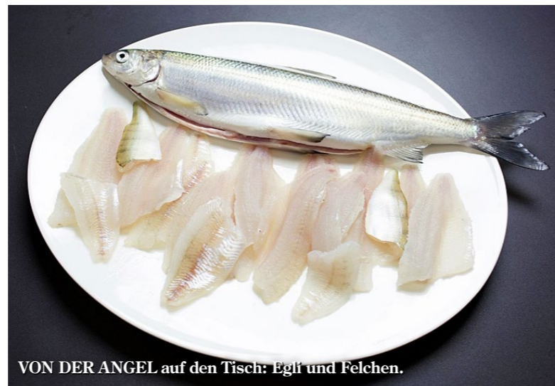
VON DER ANGEL auf den Tisch: Egli und Felchen.