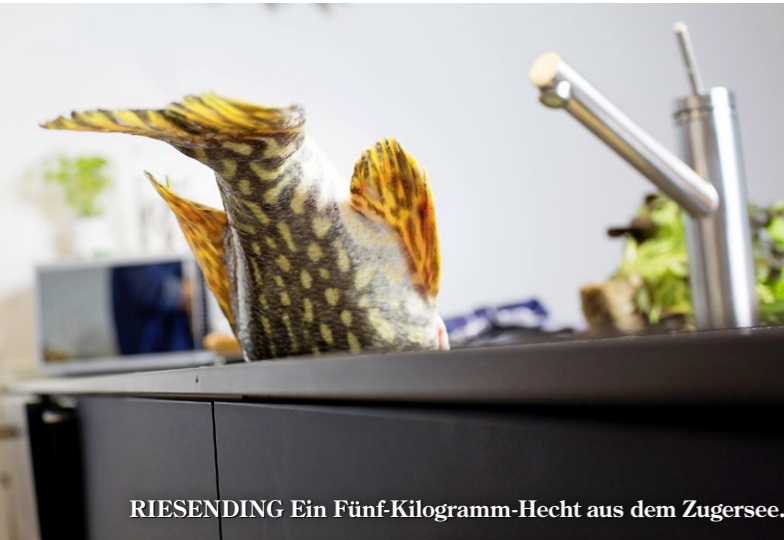
RIESENDING Ein Fünf-Kilogramm-Hecht aus dem Zugersee.